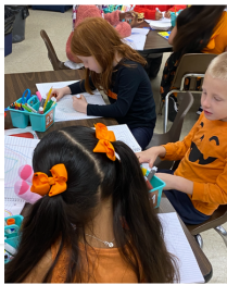
Día de los muertos- Viste de amarillo y naranja